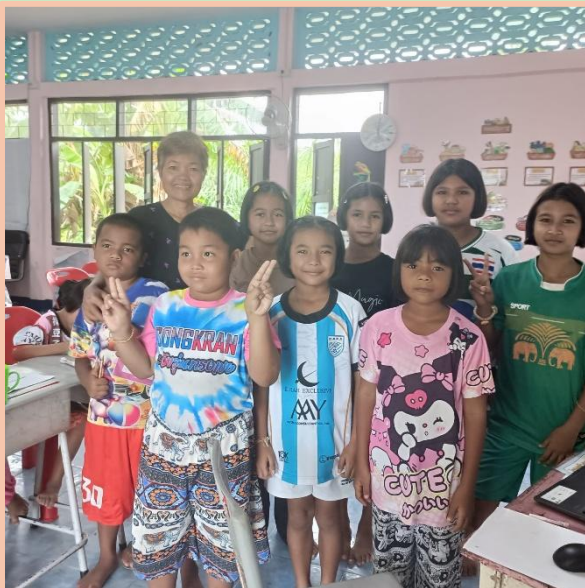
Les plus grands « Love English »