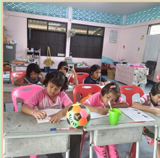
Les plus jeunes découvrent le plaisir de l'Anglais