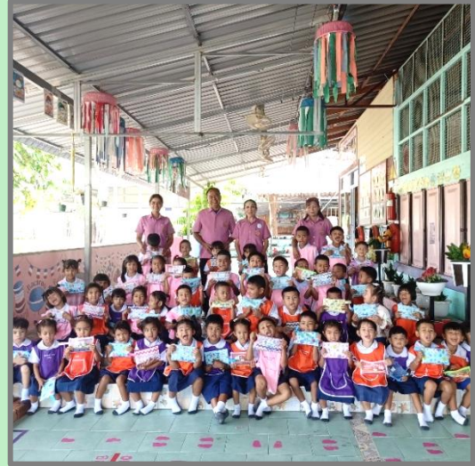
Anuban 1 en violet, Anuban 2 en rose, Anuban 3 en Orange. Elles sont super nos trousse avec gomme et crayons à l'intérieur