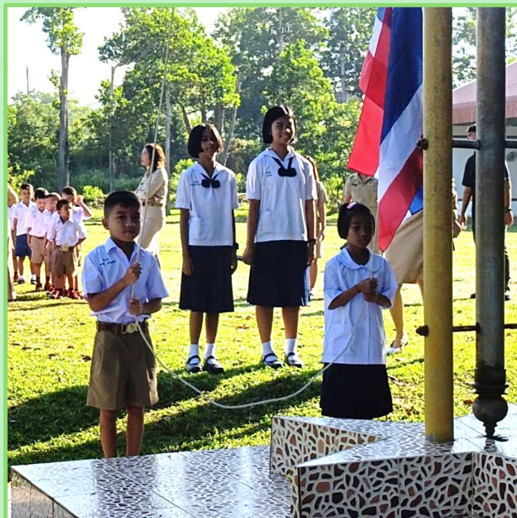
Premier lever du drapeau et première fois pour nous deux ! On a un peu peur de ne pas savoir bien faire