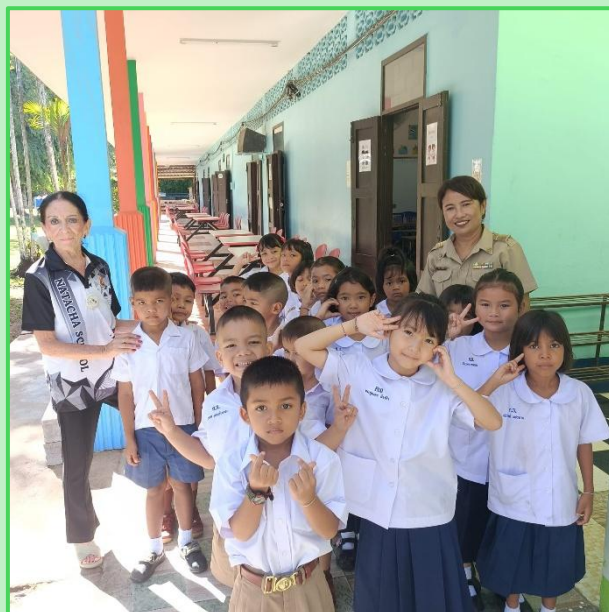
1 er jour pour les petits du CP

« L'éducation engendre la confiance. La confiance engendre l'espoir. L'espoir engendre la paix » écrivait Confucius. Nous avons effectué la rentrée scolaire 2026/2027 dans cet esprit, à notre petit niveau naturellement, mais avec cet espoir accroché au fronton de Natacha School. 21 e rentrée en ce qui concerne NAT Association puisque nous avons commencé notre aventure en avril 2005. Cette aventure qui, grâce à vous tous, conduit beaucoup de nos enfants sur leur propre chemin dans la joie et la créativité. Souhaitons leur en effet d'être porteurs de la paix dans ce monde en plein bouleversement. Et n'hésitez pas à continuer à nous soutenir pour que nous puissions continuer à N aître, A ider, T ransmettre.