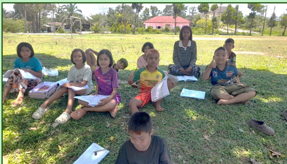
On the green, on the grass