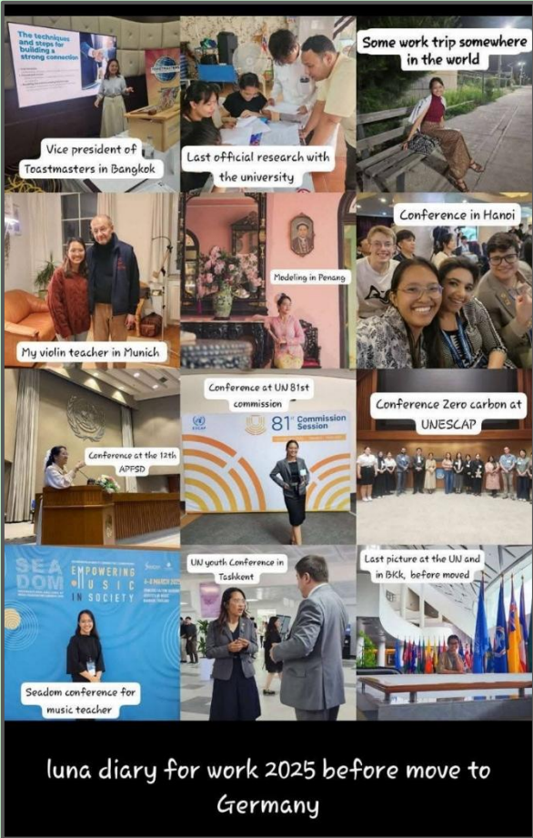
Avant le voyage à Munich de Baiphon

Ces deux demoiselles sont heureuses de pouvoir commencer à vivre de leur art et je peux témoigner qu'elles travaillent énormément ; elles ont parfaitement intégré la chance qu'elles ont eue et continuent de témoigner. « La Musique est essentielle à l'existence » écrit Nietzsche ; elles en sont une belle preuve.